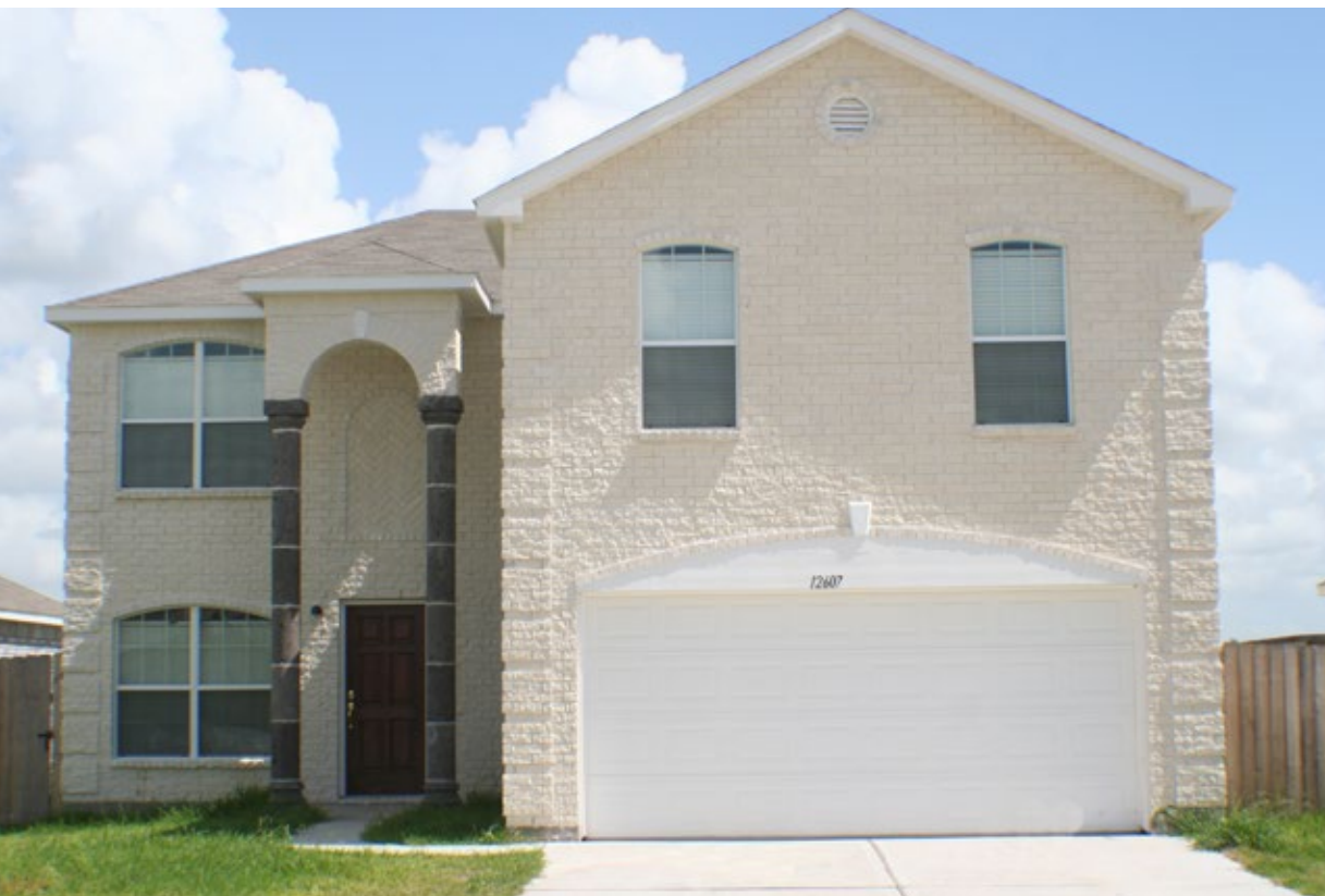
F561- R, Light Buff