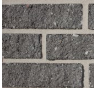
Slate Gray F521-R