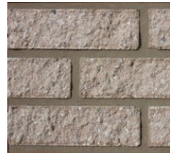
Sand Stone F571-R