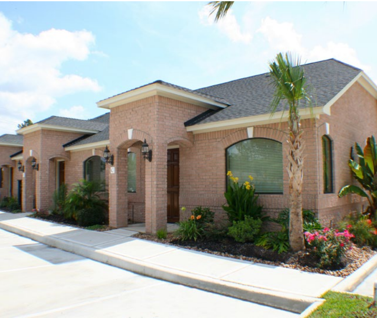
F531- R, Walnut Brown