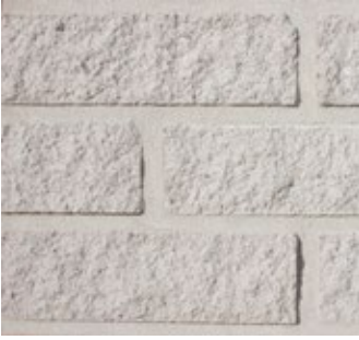
Arctic White F501-R