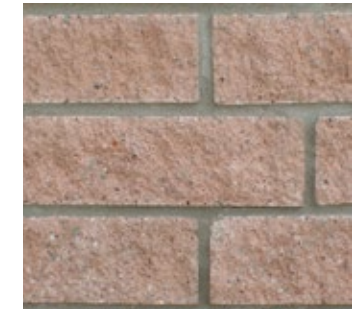
Walnut Brown F531-R