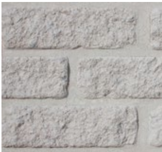
Arctic White Tumbled F501-RT