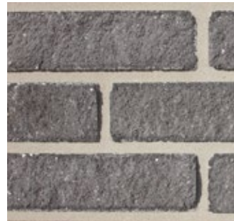
Steel Gray F591-DR