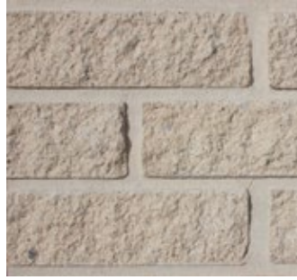
Light Buff F561-R